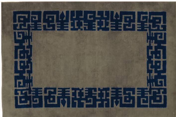
AZTÈQUE - TAUPE & SAPHIR