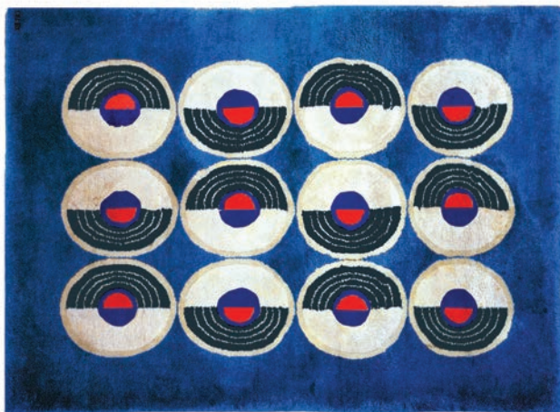
CONSTELLATION - BLEU ET ROUGE ÉLECTRIQUE