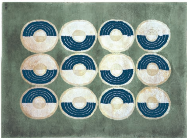
CONSTELLATION - TURQUOISE MENTHE CLAIR & MARINE